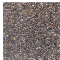
Dansk Sjösten 2130076H