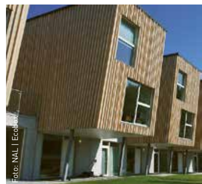
Norwegian Wood-projektet Marilunden i Stavanger, utarbetat av EderBiesel Arkitekter, Rogaland projektering och utbyggnad av Base Property. För projektet användes 18 mm Hunton Vindtät.