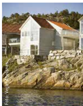
Stugor från projektet Furuholmen har använt Hunton Vindtät 12 mm.