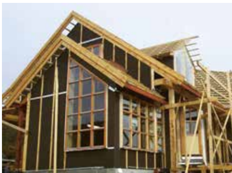
Nyproducerat hus med Hunton Vindtät som vindskydd där Hunton tejp och primer ökar tätheten på klimatskyddet.

Hunton Fibers Tejp och Primer produceras av SIGA, den ledande producenten i Europa som utvecklar och producerar produkter utan skadliga material i tejplosningarna. Tejpen är diffusionsöppen, flexibel, UV-stabil, regntålig och åldersbeständig i upp till 50 år.