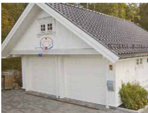
Om du vill ha ett ombonat garage kan det vara en bra idé att använda Hunton Vindtät.