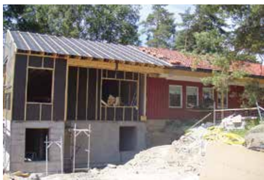
Tillbyggnaden av Sons naturdaghjem börjar ta form. Hunton Vindtät ser till att byggnaden är tät.