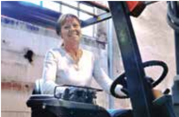
Här tillverkas träfiberskivorna.

Hunton Vindtät tillverkas vid vår fabrik i Gjøvik, Norge. Det hårda norska klimatet gör att skivorna måste vara extra motståndskraftiga mot väder och vind. Att Hunton Vindtät står emot kallt, fuktigt, men också varmt väder har gjort den populär över hela världen. Nästan 50% av alla asfaltskivor som vi tillverkar exporteras.