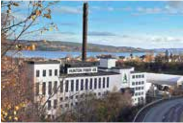
Huntons fabrik i Gjøvik.