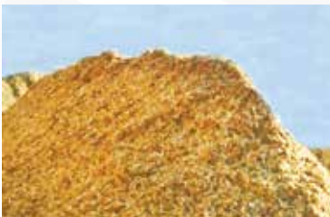
Från vårt råvarulager (flis) i Gjøvik.

Hunton Vindtät tillverkas genom en miljövänlig process där flis från sågverk mals ned till en fin massa. Massan tillförs sedan stora mängder vatten innan den pressas samman till en porös träfiber skiva. Fibrerna binds samman med lignin – träets eget naturliga lim. Skivan är en ren träprodukt, impregnerad med asfalt för att öka fuktmotståndet. Impregneringen gör Hunton Vindtät åldersbeständig och motståndskraftig mot mögel, röta och skadedjursangrepp.