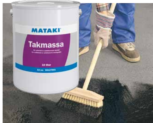
Alla takpapp bör underhållas regelbundet med Mataki Takmassa.

Underhåll ditt takpapp regelbundet så håller det länge. 10-15 år efter att du lagt ditt takpapp bör du börja underhålla med Mataki Takmassa. En enda strykning räcker för att ditt tak ska fungera bra i flera år till. Även ett takpapp som börjat bli gammalt och uttorkat kan få ett nytt liv. Då bör du först behandla taket med Mataki Asphaltprimer.