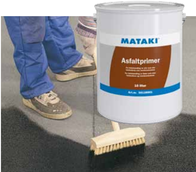
Om taket är gammalt och uttorkat bör du först grunda med Mataki Asphaltprimer.