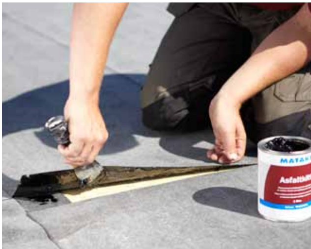
Mindre revor eller skador i papptaket repareras med Mataki Asphaltkitt.

För att hålla fukten borta bör du reparera skador och sprickor så snart du upptäcker dem. Skador på papptaket lagar du enkelt med Mataki Asphaltkitt eller Mataki Byggtejp. Den senare är en självhäftande tätningsremsa som lagar nästan allt, från skador på skorstenen till sprickor i hängrännan.