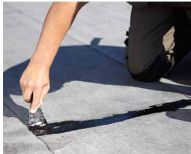
Mataki Asphaltkitt fäster bra på alla material som ska klistras.

Materialet i Mataki Byggtejp är aluminiumfolie som belagts med ett väderbeständigt lackskikt på ovansidan och självhäftande asfaltklister på undersidan. En bra arbetstemperatur är mellan +5°C och +25°C. Om det är kallt ute kan du underlätta arbetet genom att värma remsan lätt. Tejpen bör förvaras i max +25°C.